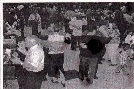
La piste a été prise d'assaut.