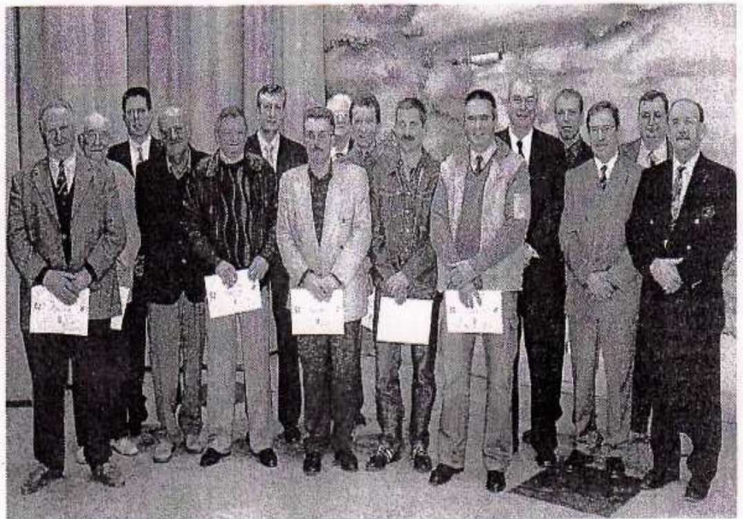
Les diplômés «Jeunesse et sport».