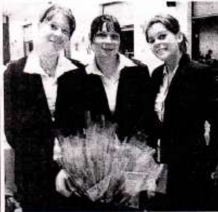
Les demoiselles accueillies avec une rose.

Samedi soir, le football-club de Valff invitait les Valentin et les Valentine à une soirée festive dans la salle polyvalente décorée pour l'occasion.