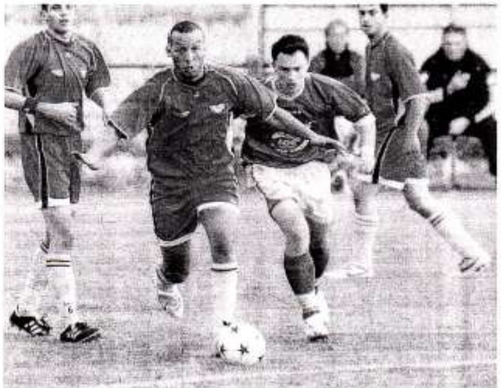
Deuxième de leur groupe, les joueurs du FCV visent l'accession.

Les 15 ans dans cette première partie de championnat obtiennent de très bons résultats et se classent seconds de leur groupe avec deux matchs en retard. Les résultats