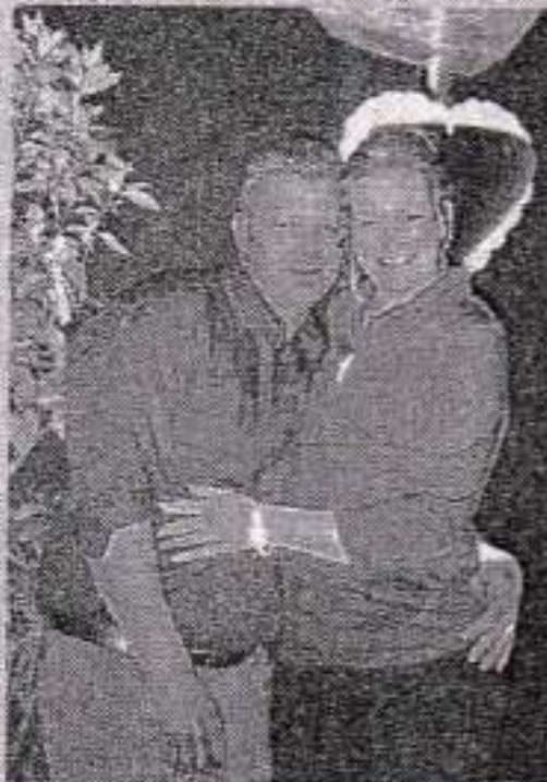
Pour fêter saint Valentin.

Au détour d'une table, un couple d'un certain âge a avoué en être à sa cinquantième Saint-Valentin, devant les yeux émerveillés d'un jeune couple qui fêtait sa première année