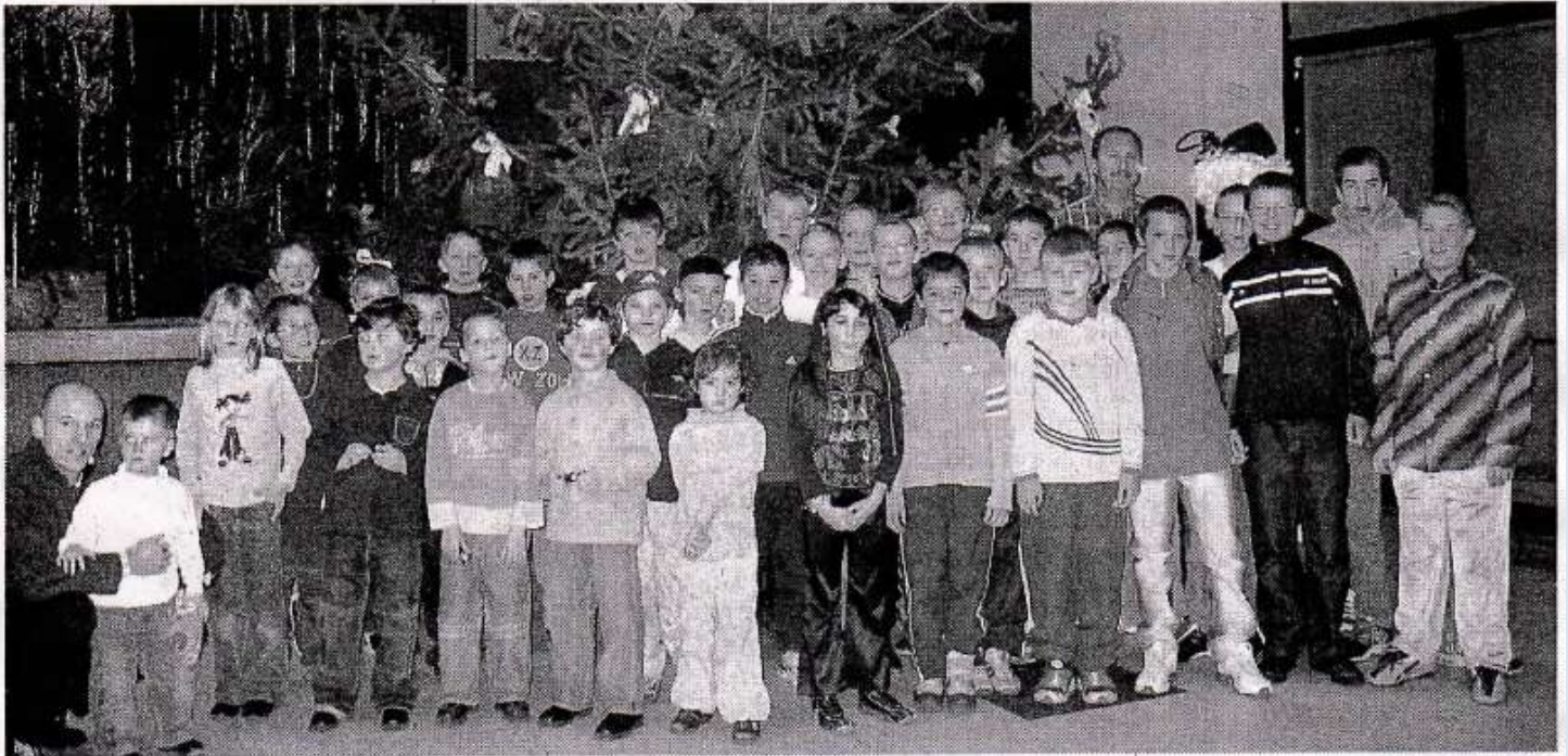
Tous les jeunes footeux réunis avant de reprendre la saison.