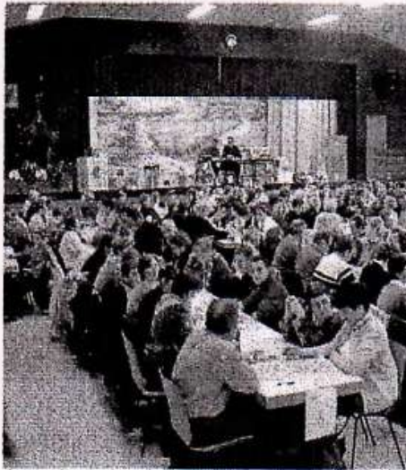
Une salle bien remplie.

Dimanche, la salle polyvalente de Valff a hébergé plus de 500 personnes venues participer au loto-bingo non fumeur organisé par le Football-Club de la commune.