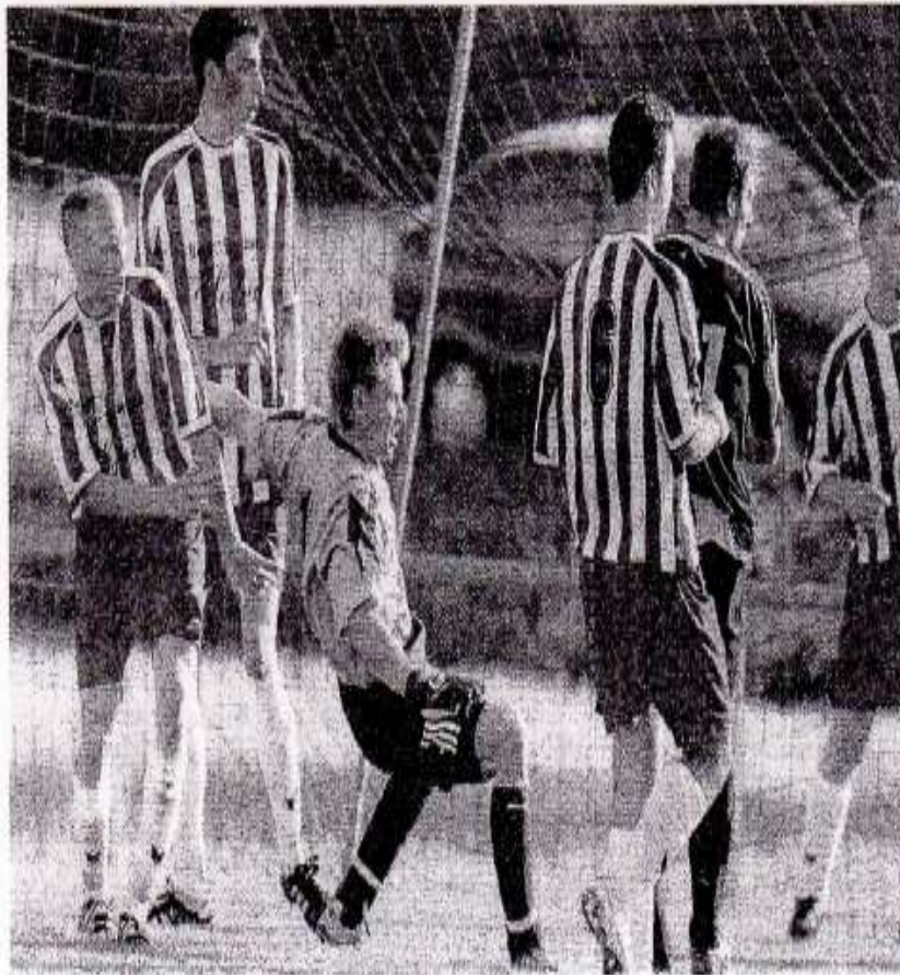
L'équipe fanion se maintient en Division 1.

Le match de gala entre Geispolsheim et le FC Koenigshoffen 06 a été d'un excellent niveau (victoire du FCSK). Après la remise de maillots aux jeunes, les 15 ans de Valff ont perdu contre l'entente de Bergbieten. S'ensuit une rencontre