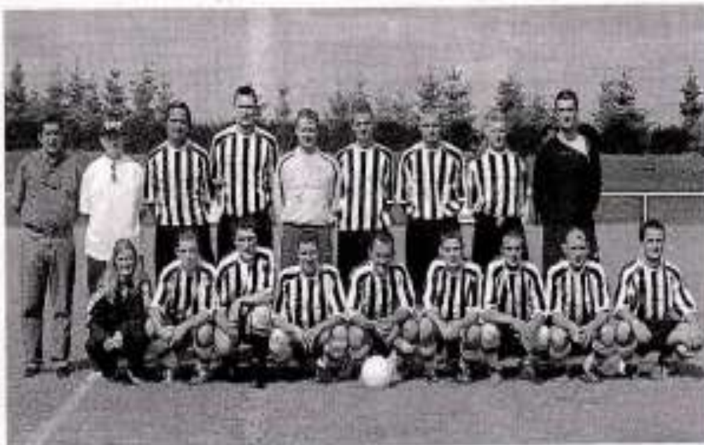
Le FC Valff débutera à la rentrée une nouvelle aventure.