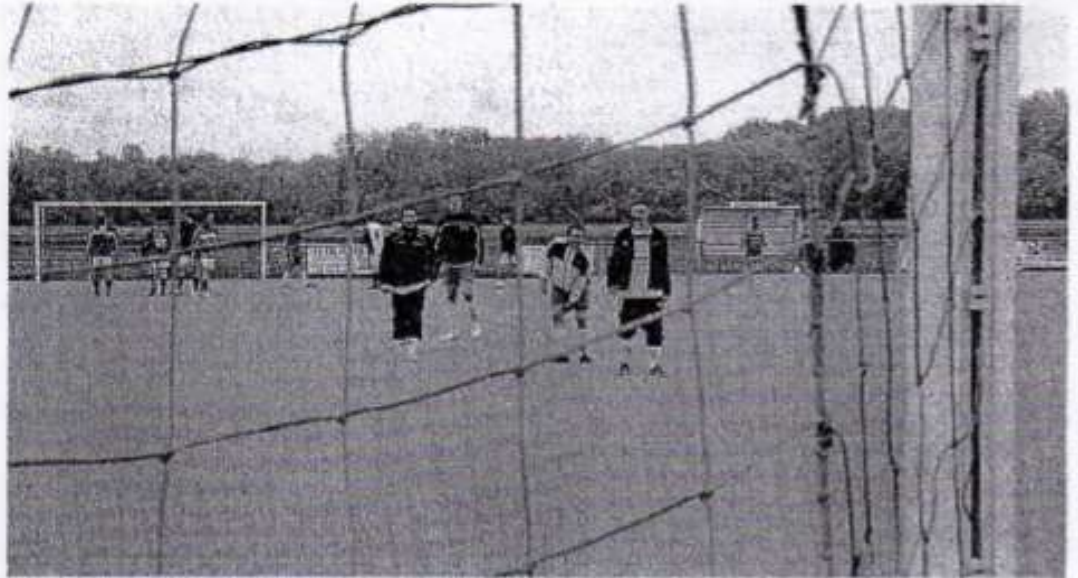
Ambiance détendue d'avant-match.

Aussi loin qu'on s'en souvienne (certains évoquent la création du club en 1946), au FC Valff, le tournoi vétérans de la Pentecôte a toujours été un rendez-vous clef du calendrier.