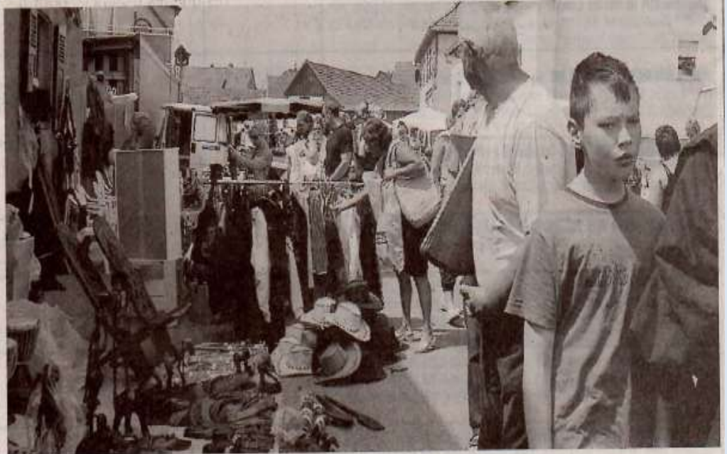
De nombreux visiteurs sont venus au marché aux puces du FC Valff.