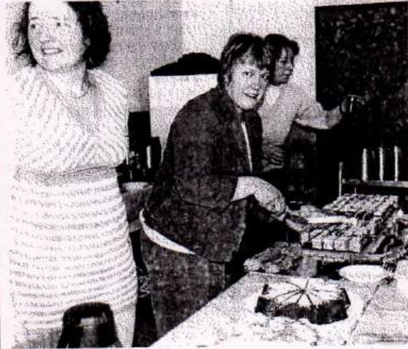
Pour assurer la logistique des joueurs, les dames du club mobilisées à la pâtisserie.

Hier, le football-club de Valff jouait une nouvelle carte, en salle.