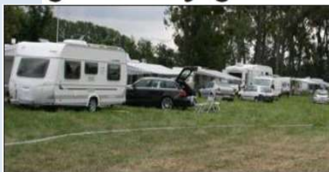
Les 80 familles de la communauté des gens du voyage ont pu s'installer dans un pré communal à 700 mètres du village de Valff.

Quatre-vingts familles des gens du voyage ont installé leurs caravanes sur un pré communal de Valff. Dimanche, elles avaient investi les terrains de football de la commune.